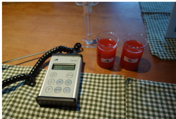
Abb. 2: Messplatz für zwei gleichartige Parallelproben