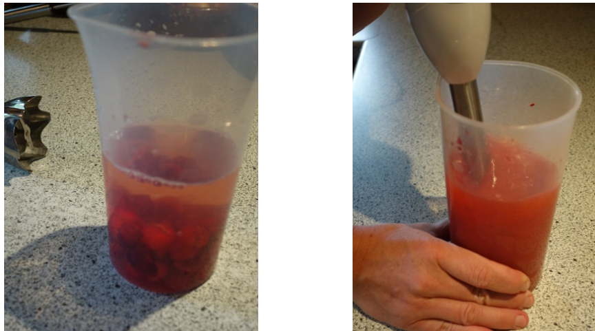
Abb. 1: Herstellung einer Probe

Die Messprobe wurde 1 Stunde auf der von der Fa. Lakosa behandelten Kühltischmatte aufbewahrt, während die Referenzprobe nicht mit einer solchen Matte in Berührung gekommen war. Von jeder Probe wurden zwei Messungen durchgeführt (Referenzprobe: A und B, Messprobe: C und D).